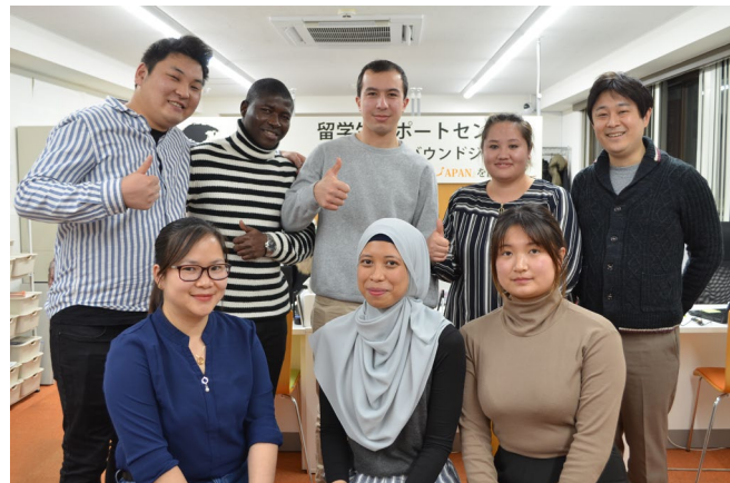
弊社所属の支援担当者

相談業務についてはプライバシーに十分配慮いたします。 また、入管法や特定技能制度、及び労働関係法令等の相談については入国管理局、弊社の顧問行政書士、顧問社労士などにも確認しながら正確な情報を迅速にお伝えいたします。